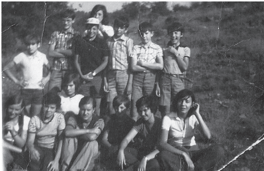
Hace 35 años...

La comenzamos tomando unas cervecitas y viendo fotos de hace unos cuantos añitos no parábamos de comentar ¿quién es este? y ¿esta otra? Después de unas cuantas risas decidimos bajar al local de la peña a darnos un homenaje por otra parte bien merecido.