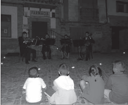
Música, medicina milagrosa

Por los carteles y por el boletín anterior, nº 78 informábamos de esta Semana Cultural. Nuestra Asociación quiere dar las gracias a cuantas personas han llevado a cabo esta actividad; sin ellas nada habría sido posible.