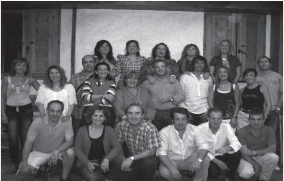
En la actualidad

Sin más que contar un abrazo a todos y ¡Gracias por venir!