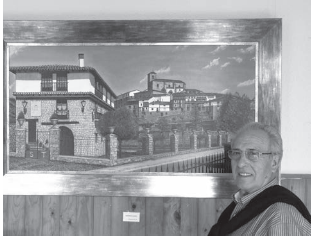
El Artista posa junto a su obra

hay cuadros que se pintan en unas siete horas, por ejemplo, el ganador del primer premio del concurso de pintura de este año - que para mí es un gran cuadro -. Me parece increíble poder pintar una obra tan bonita: toda la panorámica del pueblo vista desde las eras de San Pedro.