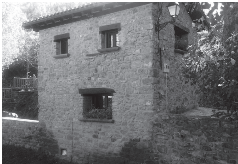
Residencia en Velilla

Propone un plan variado: visita a Logroño y a alguna de sus bodegas, el museo Würth, gastronomía y casco antiguo; después algo de Rioja Alta (Haro, la zona de los Monasterios,...); en Rioja Baja los pueblos cercanos a Arnedillo le gustan mucho y el valle del Cidacos, y finalmente un paseo por Los Cameros, ¿completo verdad?