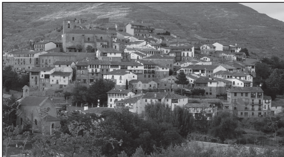
San Román de Cameros, agosto 2010