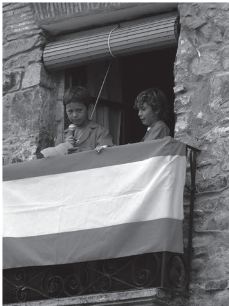
Pregoneros de las Fiestas de agosto 2010

Para empezar queremos mostrar nuestra gratitud por un hecho que creemos ha sido importante este verano: la restauración de “nuestra fuente”, fuente a la que debemos el nombre, la fuente de Los Linares. Los “Amigos de los ríos” junto con el voluntariado de diversos vecinos del pueblo, dedicaron un par de fines de semana a mejorarla. Se han saneado los alrededores; se ha canalizado el agua que se perdía por el camino; el pequeño lodazal que se formaba alrededor de la fuente se ha sustituido por un empedrado; y también se ha vallado la para evitar que los animales accedan a ella. En resumen, ha quedado muy bonita. Nos consta que algún padre se ha animado a pasar a merendar con niños del pueblo alguna tarde. Aunque ya el tiempo no lo permite, esperamos que en la primavera se hagan más pequeñas excursiones de este tipo para que el trabajo presentado obtenga su objetivo.