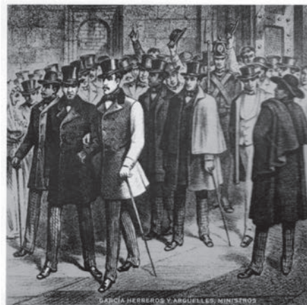
Imagen de Época

Nota: A esta petición se adjunta un breve escrito justificando la petición, así como una conclusión. En la Justificación se hace referencia a la vida y obra de García Herreros, información tomada de los escritos de José Luis Moreno en El Camero Viejo , tomo I, págs. 31-50, y de la obra de Ernesto Reinares García Herreros «El Numantino»