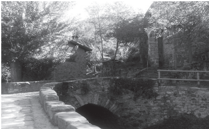
Puente de Velilla

De Cameros precisamente sabía, antes de su llegada, poco. Ahora reconoce la diferencia paisajística y natural entre los dos valles, y dependiendo del interés del viajero, recomendaría uno u otro.