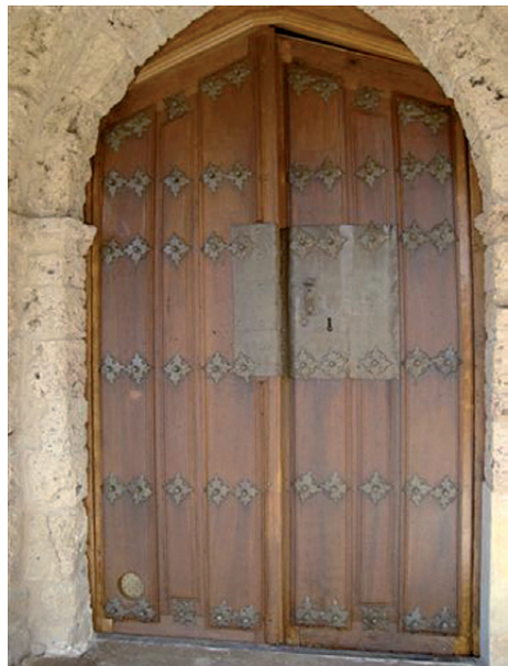
Puerta de la Iglesia restaurada