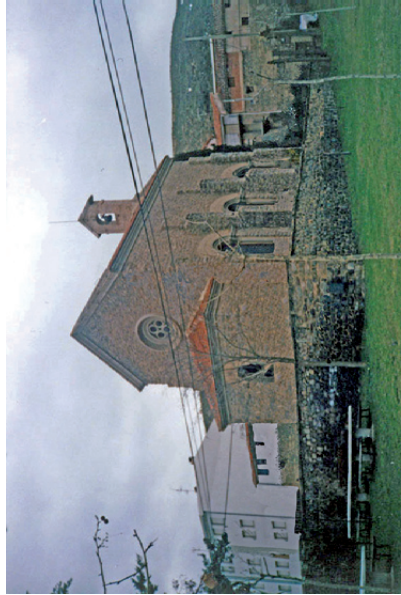
Estado sin reja