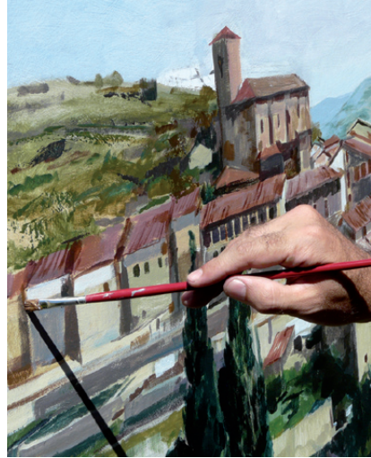
Lo que se pinta en San Román

Del 1 al 15 agosto de 2012, en la Escuela de abajo tiene lugar la exposición itinerante sobre fotografías de Folclore riojano cedida por la Consejería de Presidencia del Gobierno de La Rioja.