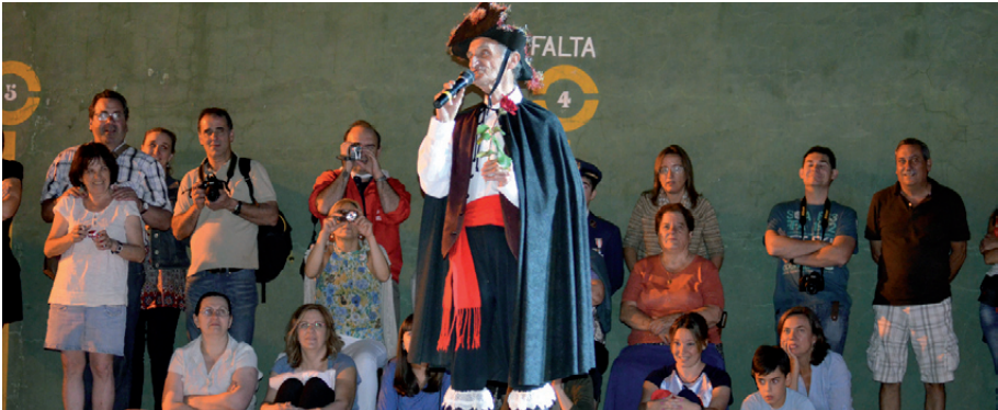
Primito en la Plaza

Al día siguiente, domingo, volvió el matarife para realizar el despiece del cerdo y se preparó un menú a base de garbanzos con berza.