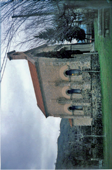
Estado sin reja