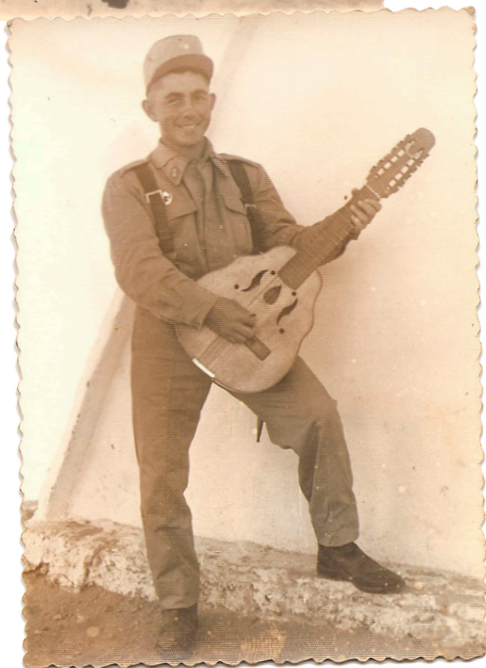
Fotografía número 3: Y la última ¡la mejor! Elvis Presley a punto de dar un concierto ¡qué majo Pablito Cuesta! Mi cariño para ti, guapo. La foto me la dejó la familia. Hay más de los Cuesta pero para el próximo número.