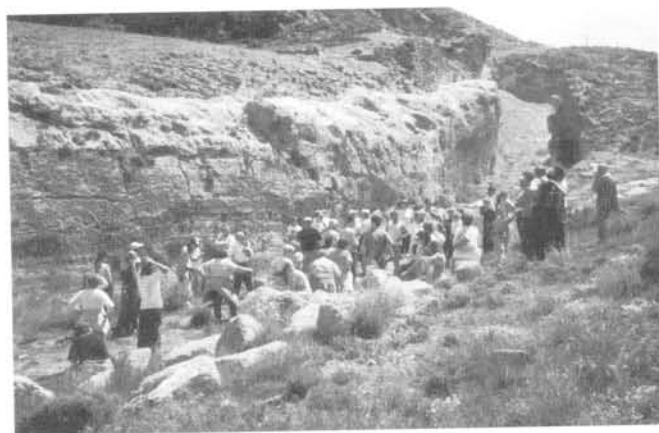
El impresionante foso del yacimiento celtibérico de Kontrebia Leukade.

Concluida la visita al yacimiento se dieron por finalizadas las jornadas con la entrega de una moneda celtibérica realizada en barro por parte de los “Amigos de la Celtiberia” a los “Amigos de Villarroya”. Ahora, bien, los “Amigos de la Celtiberia” nos hicieron partícipes de su deseo de celebrar el próximo encuentro en San Román, ya que hemos estado presentes en muchas de las reuniones que han celebrado, y somos casi incondicionales en sus encuentros. Bienvenidos sean.