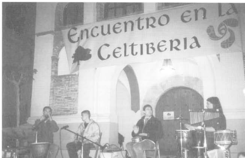
Los "Bardos, Druidas y otras movidas" en plena actuación en el pórtico de la iglesia de Villarroya

Los cuatro componentes repasaron la historia y las músicas venidas de Galicia, Asturias, de la Corte francesa y hasta de los pastores trashumantes de Cameros, mientras en la plaza bailaban sin parar niños, jóvenes y mayores hasta altas horas de la madrugada.