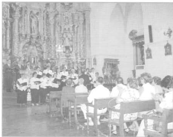
La Coral de Nalda durante su recital en la Iglesia de San Román

Atlanta (que según comentarios de los más bailones fue muy buena). Más tarde en el local de la peña más música y zurracapote fresquito alargaron la fiesta nocturna. Ya de madrugada los mozos recorrieron el pueblo colocando los ramos, y al día siguiente (o más bien, a las pocas horas) el pasacalles recorrió alegremente las calles con mucha juventud todavía con ganas de moverse con el ritmo de la charanga. A continuación tuvo lugar la procesión y misa en honor a nuestro santo Sebastián. Por la tarde, y como colofón se sorteó el cabrito y se organizó un campeonato de mus "relámpago" que alegró el morro de los ganadores con un buen par de jamones.