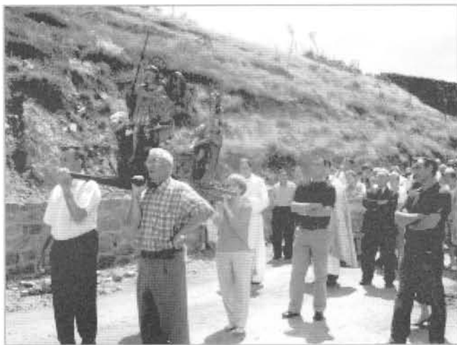
Los montalveños en una de las paradas durante la procesión

Como resulta que en enero hace mucho frío, ¡qué mejor manera de celebrar el día de nuestro patrón que trasladar su festividad al tercer domingo de junio! Esto no significa que se deje de conmemorar en su verdadera fecha, el 20 de enero, pero está claro que es