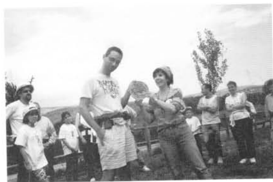
El presidente de los “Amigos de la Celtiberia” hace entrega a la presidenta de “Amigos de Villarroya” de una moneda celtibérica de barro para conmemorar el encuentro.

Concluida la visita al yacimiento se dieron por finalizadas las jornadas con la entrega de una moneda celtibérica realizada en barro por parte de los “Amigos de la Celtiberia” a los “Amigos de Villarroya”. Ahora, bien, los “Amigos de la Celtiberia” nos hicieron partícipes de su deseo de celebrar el próximo encuentro en San Román, ya que hemos estado presentes en muchas de las reuniones que han celebrado, y somos casi incondicionales en sus encuentros. Bienvenidos sean.