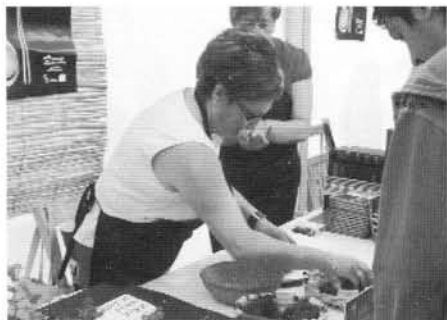
Día de la trufa en Soto

Agradecemos al autor el obsequio de un ejemplar a la Asociación de Amigos de San Román de Cameros y nos comprometemos a guardarlo y promocionar su lectura entre los cameranos.