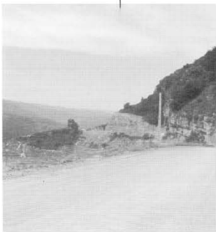
Arreglo del tramo de carretera Trevijano-Soto

Otra vez constatamos los numerosos desprendimientos de rocas y tierra, tan