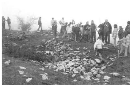
Ruinas de San Felices, Hornillos

Felices nos detuvimos ante una derruida nevera. Continuamos rodeando la Atalaya y junto al muro que delimita la dehesa echamos un bocado. Regresamos por la pista que nos une con los valles del Jubera y Cidacos, entrando al pueblo por las inmediaciones de la ermita de la Virgen de los Remedios. Finalmente visitamos la parroquia de la Asunción. A pesar de no poder disfrutar del paisaje por las