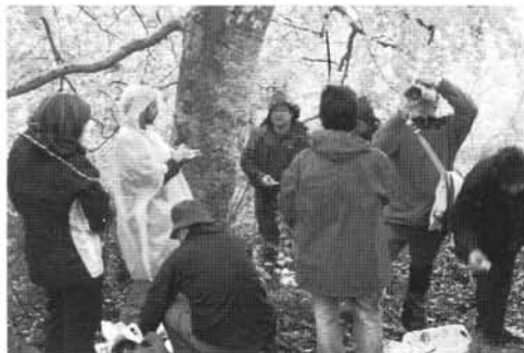
Almuerzo bajo la lluvia en el hayedo de Santa María

que nos llevaría al Solar de Tejada, junto al alto del Torco. Allí enlazamos con la ruta GR que desciende entre robles hacia el citado Solar. Nos reponemos aquí con un trago de agua fresca. A continuación ascendemos, y tras un alto para alimentar el estómago continuamos hacia cumbrear y nos detenemos en el término del Cabedín donde alimentamos el intelecto disfrutando de la lectura que nos hacen de la leyenda del tesoro del moro (tesoro que, dicen, todavía está por ahí, en el término de los Villares). Regresamos a Cabezón visitando antes el yacimiento de huellas de iguanodonte