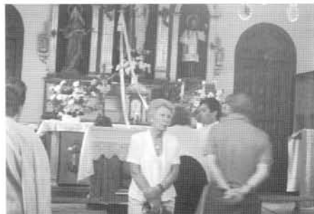
Novena a la Virgen del Carmen

Con fecha 24 de marzo, la Junta directiva de esta Asociación acordó destinar 600 Euros para contribuir al pago de