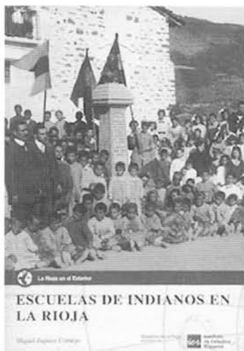
Escuelas de indianos en La Rioja

El estudio profundiza en las Fundaciones de Escuelas de Primeras Letras en nuestro Camero Viejo, en concreto de las escuelas de San Román, Soto y Laguna