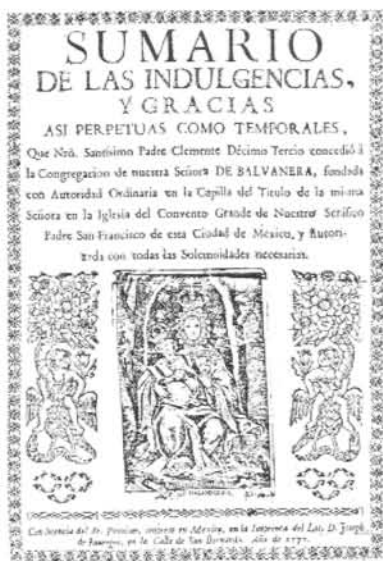
Sumario de Indulgencias

Desde su casa de la calle de Don Juan Manuel de la capital virreinal don Diego seguía controlando sus prósperos negocios, entre los que destacaba el envío de mercancías en embarcaciones de nombre tan significativo como “Nuestra Señora de Valbanera, alias la Riojana”. Ocupó diversos cargos en el Consulado de México hasta alcanzar el de Prior en 1819; por otra parte, destacó por su adhesión a Fernando VII, significándose como Capitán de la primera compañía de los Patriotas distinguidos; aportó grandes cantidades como ayuda para el ejército español durante la Guerra de la Independencia y, luego, como préstamos a la Real Hacienda (más de quinientos mil pesos). Todo ello contribuyó decisivamente a su progresivo ennoblecimiento hasta alcanzar un título en 1811, proceso que se percibe claramente a través