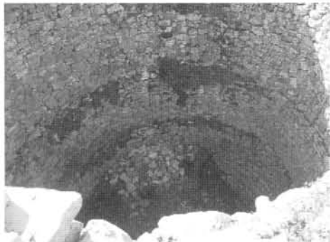
La nevera de Trevijano

aunque ventoso día casi de primavera. Nuestros amigos de Trevijano nos guiaron por su término municipal, donde comenzamos por visitar la ermita del Santo Cristo, para continuar hacia la impresionante nevera, construcción que según nos cuentan se sacaba a subasta y su adjudicatario se encargaba de su mantenimiento y de que no le faltara nieve (en años de escasez de nieve, tenían que acarrearla de donde la había). Desde aquí nos encaminamos al dolmen de Collado del Mallo, sepulcro de corredor datado entre el segundo y tercer milenio antes de Cristo. Tras reponer fuerzas con un buen almuerzo regresamos hacia Trevijano, pasando por la derruida ermita del