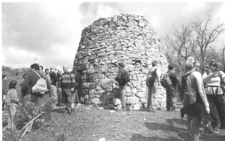
El Chozo de la dehesa de san Román.

Los fines de semana de verano nuestras calles están llenas de coches. ¿Qué podríamos hacer?