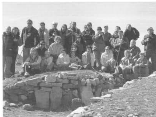
En el Collado del Mallo, Trevijano

Cúpulo. Visitamos su preciosa iglesia de San Cristóbal, y callejamos un poco por esta bella aldea.