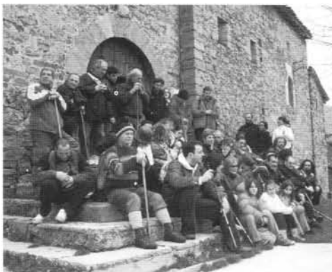
Al pie de la Iglesia de Hornillos