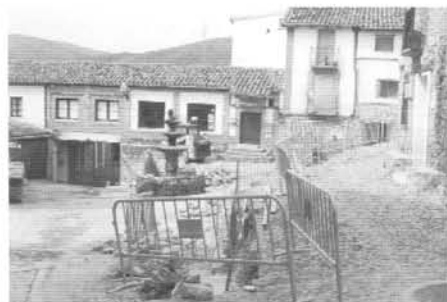
La Plaza del Olmo en obras

La calle de la Carretera ha quedado pre-