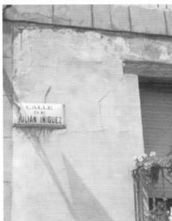
Casa de San Román con la placa dedicada