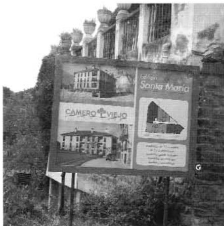
Imagen virtual del edificio

estén interesados en más detalles pueden hacerlo aquí o bien en la información que está en los bares de San Román.