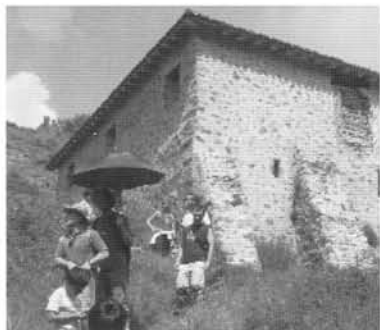
En el Solar de Tejada

de Valdemayor. Ya en el pueblo, tras recorrer sus calles, visitamos la Iglesia, con un bello retablo y con su monumento de comienzos del siglo XIX tridimensional y formado por varios lienzos.